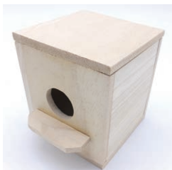
専用巣箱 (繁殖時に使用します)