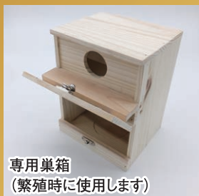
専用巣箱 (繁殖時に使用します)